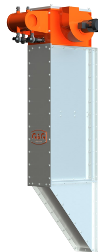
diseño de filtro vertical